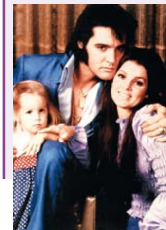
DIE PRESLEYS. Elvis, seine Frau Priscilla und Tochter Lisa Marie. Das Paar ließ sich 1973 scheiden.